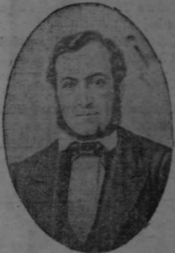
GRAL. JUAN RAFAEL MORA Glorioso vencedor de los filibusteros que capitularon el 1.º de mayo de 1857.

Mañana es el glorioso aniversario de la última página del drama centroamericano de 1857, que tuvo por teatro Nicaragua, y por protagonistas principales, un pueblo, Costa Rica, y el filibustero, Guillermo Walker.