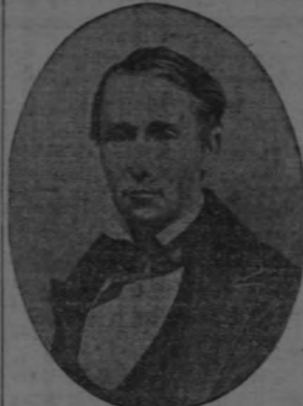
WILLIAM WALKER Jefe de los filibusteros, pasado por las armas en Honduras á las 8 de la mañana del 12 de setiembre de 1860.

Mañana celebra la clase obrera la fiesta del trabajo. Para ella han sido invitadas todas las clases trabajadoras del país, sin distinción de razas, nacionalidad, oficio, creencias religiosas y opiniones políticas. "La Prensa Libre" suspenderá sus tareas el día de mañana, y colaborará en celebrar la hermosa fecha en que los obreros formulen sus planes de lucha emancipadora. Del Manifiesto lanzado por el Comité Organizador del festival, tomamos el siguiente párrafo: "La celebración del 1.º de mayo equivale á una protesta contra todos los vejámenes que en el mundo hayan sufrido los trabajadores, á una manifestación de solidaridad con todos los movimientos de emancipación proletaria; que es una conmemoración internacional, efectuada en consecuencia en toda la tierra, en virtud de un Decreto del Congreso Internacional de Trabajadores reunido en París en 1889, el cual, por ese medio, ratificó la costumbre universal de conmemorar ese día, en recuerdo de la Huelga General que los obreros confederados de Chicago iniciaron el 1.º de mayo de 1886, y que provocó